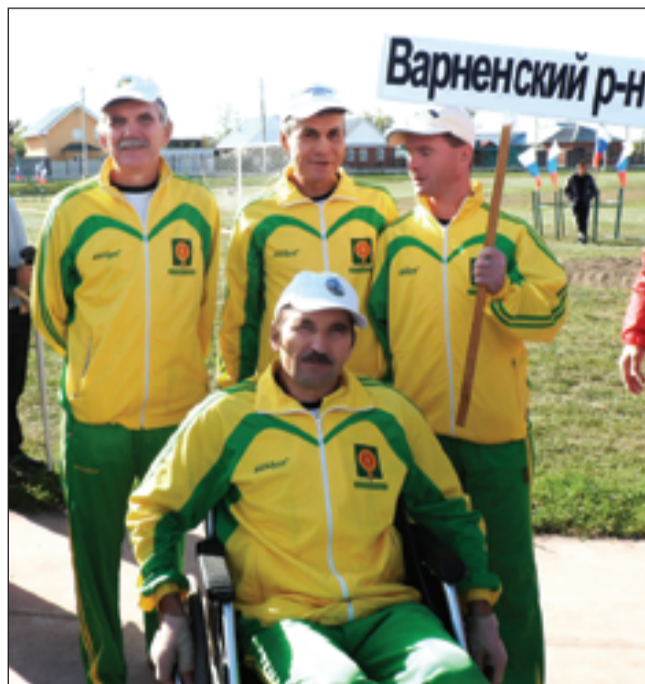
Сборная команда района на летней областной спартакиаде инвалидов

Данные районные спортивные игры стали хорошей разминкой для участия наших спортсменов в областной спартакиаде инвалидов.