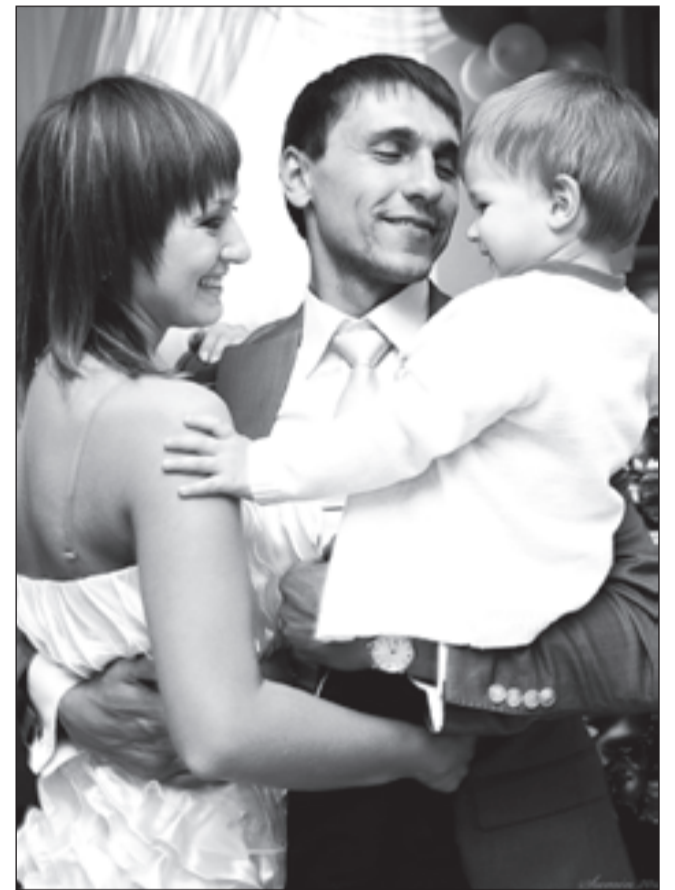
Счастье в семье заключается не в количестве человек, а в отношении друг к другу

Наш первый классный час прошел очень интересно. Родители вместе с детьми играли в игры, разгадывали загадки, строили